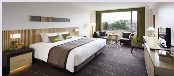
デラックスキングルーム (46.07㎡) ベッドサイズ 220cm×200cm