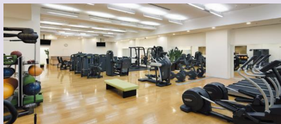
FITNESS GYM(B1) テクノジム社製の25種類以上の機器を完備しております。