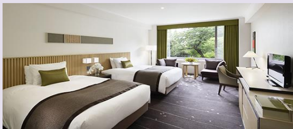
デラックスツインルーム (46.07㎡) ベッドサイズ 140cm×203cm