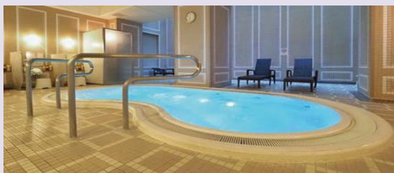
サウナ&プロアバス(B1) ドライ&ミストの2種類のサウナとプロアバスをご用意しております。